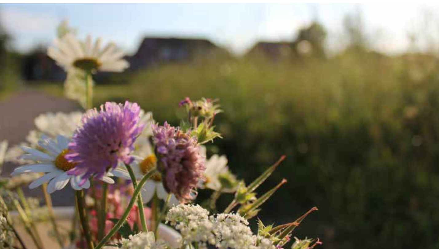
Midsommarbukett från Södra Eneby.

Flertalet av de globala målen, EUs strategi för biologisk mångfald samt våra svenska miljö kvalitetsmål har bäring på ekosystemtjänster. Enligt ett av etappmålen till miljö kvalitetsmålen ska en majoritet av Sveriges kommuner till år 2025 integrera ekosystemtjänster i planering, byggande och förvaltning av den byggda miljön i städer och tätorter. Även i de friluftspolitiska målen lyfts ekosystemtjänster kopplade till hälsa, rekreation och friluftsliv fram. Anledningen till detta är att människan är beroende av naturens ekosystemtjänster. Parker, grönområden och tätortsnära natur är i detta sammanhang en viktig förutsättning för att miljön i våra tätorter/samhällen ska vara långsiktigt hållbar, hälsofrämjande, trygg och attraktiv.