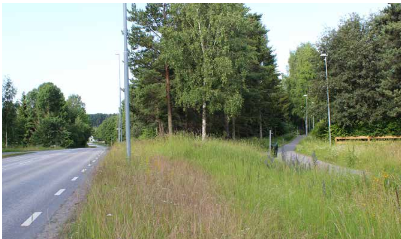
Grön skiljeremsa mellan väg och gång- och cykelväg, Kalmarleden

För att grönstrukturen i våra samhällen ska fungera både ur social och ekologisk synvinkel behöver de hänga samman med den gröna strukturen på regional nivå (så kallad grön infrastruktur). Om vi bygger våra samhällen så att grönområden utgör isolerade öar i ett landskap av bebyggelse och trafikinfrastruktur förlorar vi dess samhällsekonomiska nyttor. På så sätt skapar vi mindre hållbara och attraktiva samhällen.