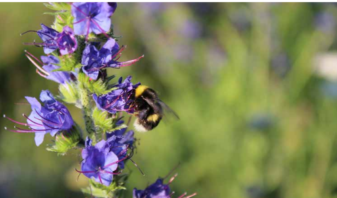
Humla på blåeld, Skörby.

I kommunens naturvårdsplan finns de mest värdefulla områdena ur naturvårdssynpunkt med, vilka utgör viktiga kärnområden för den biologiska mångfalden i Håbo kommun. En betydande andel av de utpekade områdena är kopplade till ädellövsmiljöer längs med Mälaren, torrängar i det gamla odlingslandskapet samt land- och vattenområden längs med åsarna. Dessa naturtyper är skapade genom en kombination av mänsklig påverkan och naturliga faktorer. För att dess värden ska bevaras och utvecklas behövs en allmän kunskap och förståelse för varför de är viktiga samt en ambition att sköta dem på ett sådant sätt att värdena består. Förståelse och