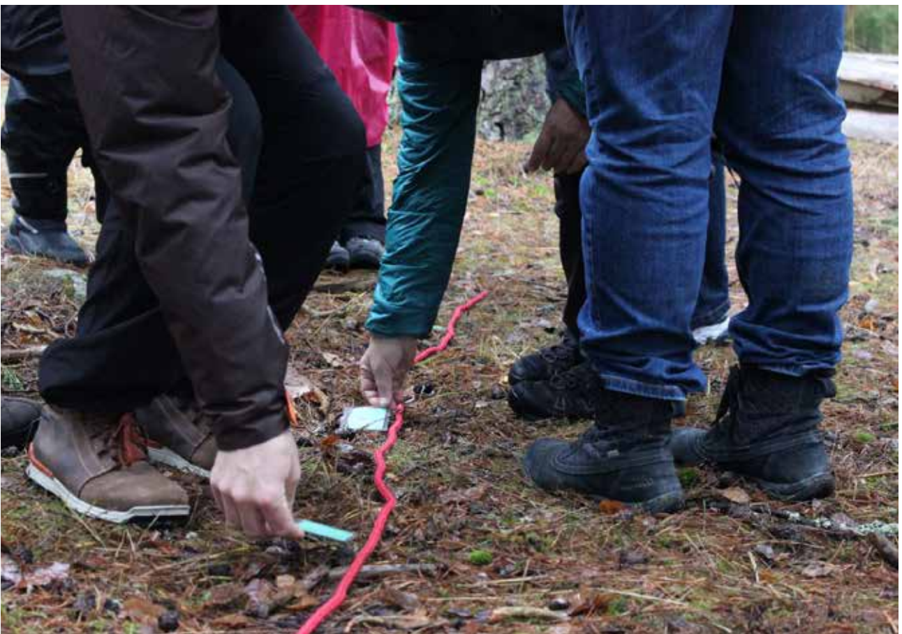
Samverkan krävs för att klara uppgiften.

Som stöd i planering och förvaltning finns ett kartunderlag som innehåller en sammanvägd bedömning av grönområdenas värde med avseende på rekreation, biologisk