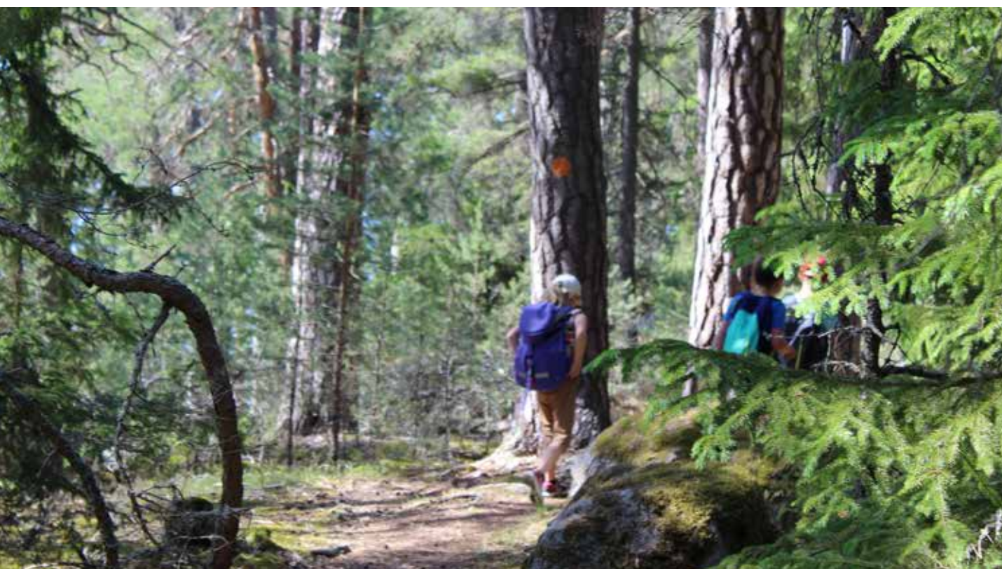
Vandrarleden intill Lilla Ullfjärden.

Närhet till skyddad natur är av särskild betydelse för människors hälsa, friluftsliv och rekreation. Att naturen är skyddad gör att människor har tillgång till den långsiktigt, vilket är särskilt viktigt i tätortsnära områden där exploateringstrycket är hårt. 2 Den tätortsnära naturen ska utgöra arena för det nära, vardagliga friluftslivet, områden för dagsutflykter och områden för helgutflykter. En hållbar rekreativ grönstruktur karaktäriseras av tillgänglighet för människor, sammanhängande grönstruktur som möjliggör rörelse mellan olika områden och variation av rekreativa kvaliteter som kan