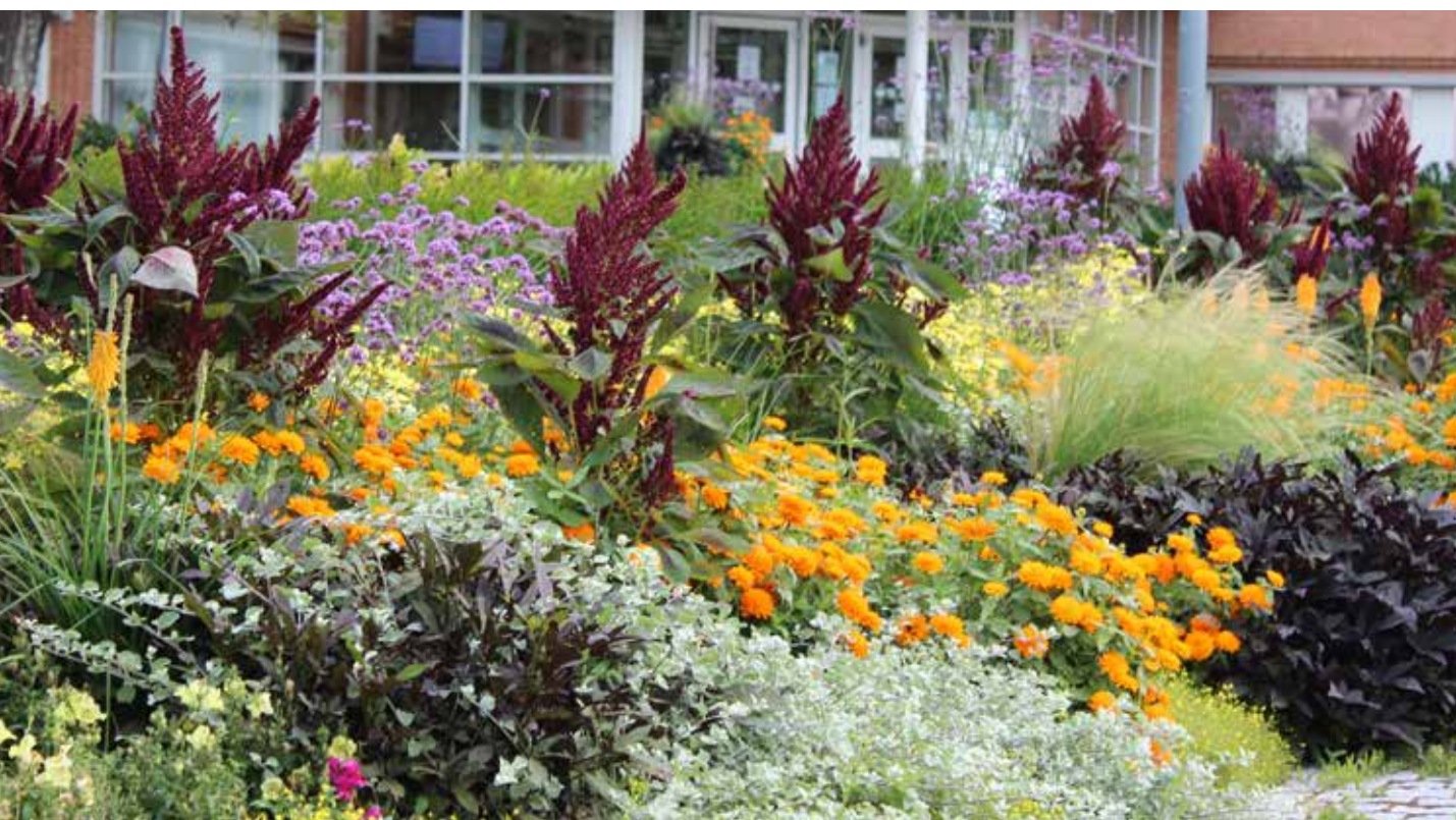
Plantering i kommunhusparken.

Parker är ofta förknippade med rekreation och umgänge. För att skapa attraktiva parker måste grönskans positiva värden för social samvaro och estetik liksom ekologiska värden förenas med trygghetsskapande åtgärder 1 . Trygghet skapas genom närhet, god belysning, möjlighet att sitta ner och vila samt genomsiktighet. Dessa aspekter måste även beaktas i planering av vägarna till parken. En väl planerad belysning, både på vägen dit, möjlighet att vila på vägen och en genomsiktighet som ger kontroll över platsen är viktiga faktorer för att parken och vägen dit ska upplevas som trygg. Vad som är attraktivt kan variera från person till person och årstiders växlingar kan också påverka hur