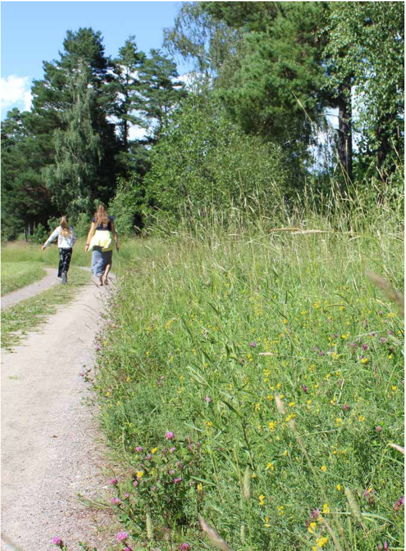
Mångfaldsrika naturmiljöer som ger oss människor mängder med ekosystemtjänster. Grusväg i Skörby.