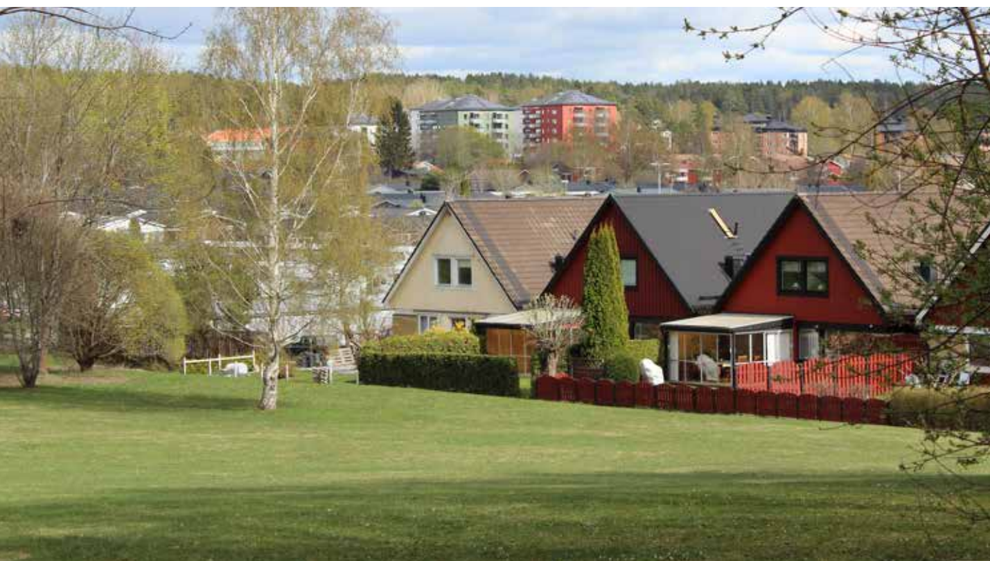
Grönytor i anslutning till bebyggelse som har en viss klimatreglerade funktion, Västerängen.

Genom en god fysisk planering och gestaltning av den fysiska miljön kan temperaturen regleras lokalt. Detta är särskilt viktigt i områden som ligger i anslutning till