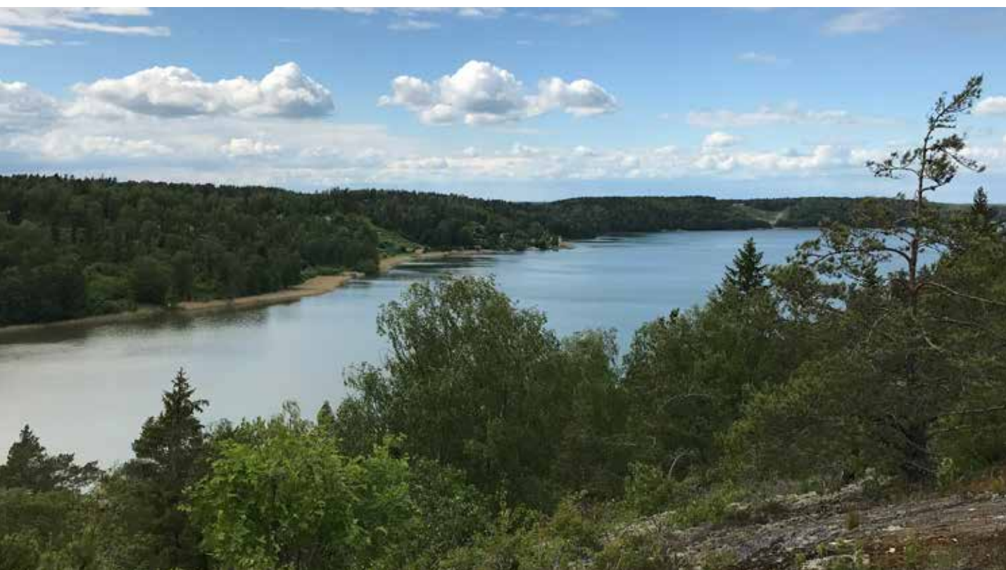
Utsikt över Lilla Ullfjärden och Granåsen.

För att bibehålla ekologiska funktioner och ekosystemtjänster i landskapet är det av stor vikt att det finns funktionella gröna samband innehållande värdekärnor med hög biologisk mångfald. Det finns studier som visar att det krävs ett avstånd på 250 - 300 meter för att människor ska uppleva en ostördhet från en störande omgivning. Om en störning kommer från två håll krävs