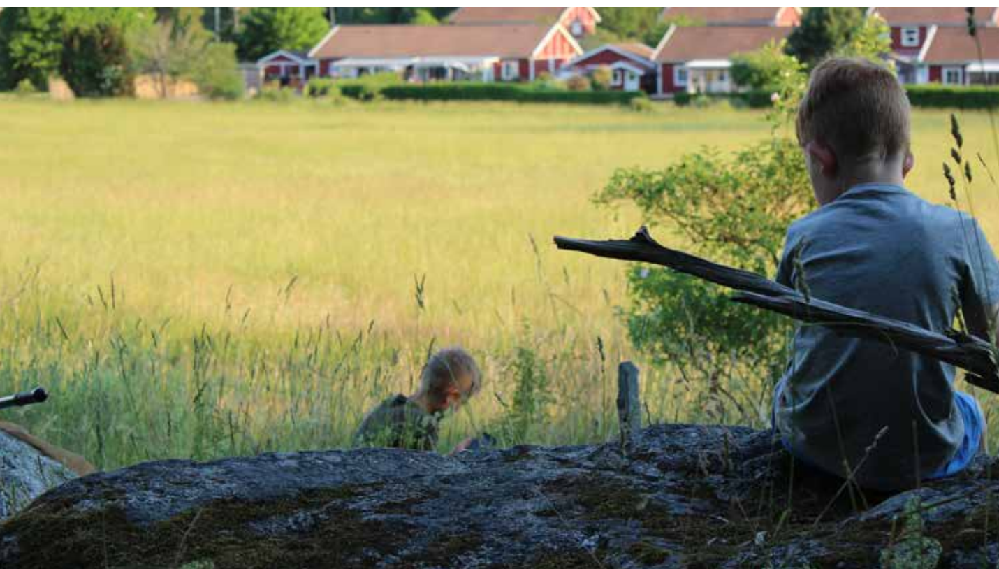
Bamseskogen intill Broby backar.

Idag bor ca 90 procent av Håbo kommuns befolkning i någon av kommunens tätorter, där den allra största andelen bor i Bålsta. Det är också en barnrik kommun där 23 procent av invånarna är mellan 0-15 år. Kommunen är ansvarig för att beakta allmänna intressen vid planläggning och lokalisering av bebyggelse, och ansvarar oftast för den allmänna platsmarken som ska vara allmänt tillgänglig för alla 1 . Att utgå från barnens perspektiv i planeringen gynnar alla. Den bostadsnära och skolnära naturen är en viktig del i barnens infrastruktur tillsammans med bostadsgårdar, lekparker, skolvägar och skolgårdar 2 . Närhet är en viktig faktor, särskilt för barn och äldre.