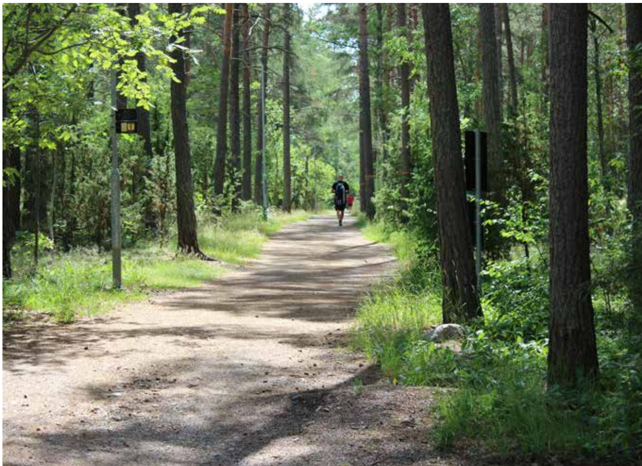
Hälsans stig, Bålstaåsen.

Vi har goda förutsättningar att vara en växande och hållbar kommun. Håbo kommuns karaktärsdrag med en mälarnära natur, kulturhistoriskt rika miljöer och gröna bostadsområden är också några av våra främsta tillgångar för en hållbar samhällsutveckling. Åsmiljöerna, det äldre herrgårdslandskapet och det kulturhistoriska odlingslandskapet hyser höga natur- och kulturmiljövärden. Här har de flesta invånare inte särskilt långt till närmaste grönområde eller strand och skolor och förskolor har goda möjligheter att bedriva verksamhet ute i den skolnära naturen. De bostadsnära grönområdena bidrar till värdefull klimatreglering och de många villaträdgårdarna är ett viktigt inslag för pollinerande insekter. En besöksnäring med fokus på natur- och kulturturism ha här stor potential att utvecklas och växa.